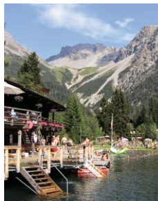
BADI & STRANDBAD

Zauberkräuter sammeln Die Geheimnisse und Heilkräfte von einheimischen Pflanzen entdecken. Wie sehen sie aus, was haben sie für eine Geschichte? Aus den gesammelten Kräutern stellen wir Eistee und Sirup her.